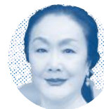
しらいしかよこ 白石加代子