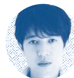
やくまるしょう 薬丸翔