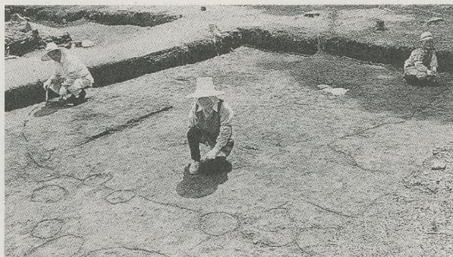
▲竪穴式住居の輪郭が見えてきました

博物館建設のため、現在いろいろな資料を収集しています。文化課(文化会館内/■内四〇八)まで情報をお寄せください。