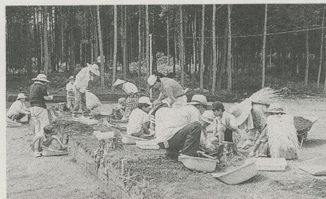
▲1997年7月に行われた体験発掘