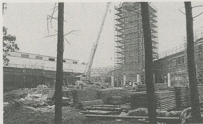
建設中の「文化の森」 ▲

(仮)文化の森では、美濃加茂の歴史についても学ぶことができますし、詳しく調べる事ができます。また、みなさんが参加できる体験発掘を行ったり、昔の家の跡を見学できる場所も設けられる予定です。