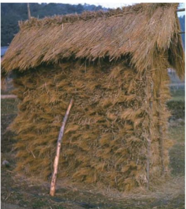
「積みワラ」 昭和37年11月9日撮影

屋根の葺き替えをするときには「フキシ」とよばれる村の中でも職人級の人を中心にして、集落の男性が総出で手伝いました。多くの人が、葺き替えの技術を持っていました。