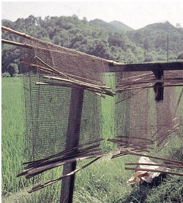
「蚕飼いの網」 昭和40年8月1日撮影