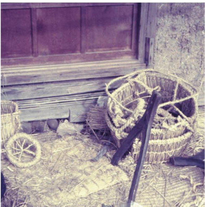
「わら仕事②」 昭和43年1月撮影

右の写真は、ビクと鍋敷きを作っている様子です。下の写真のビクの前には、俵を作るときに使う道具の一部が見えます。