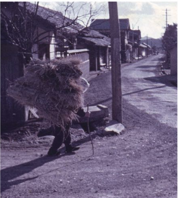
「背板」 昭和38年3月4日撮影

冬に、隣町へ大八車でまきなどを運ぶときは、日が昇り霜が解けると道がぬかるんで引きにくくなるため、朝早く出発し凍った道を行きました。