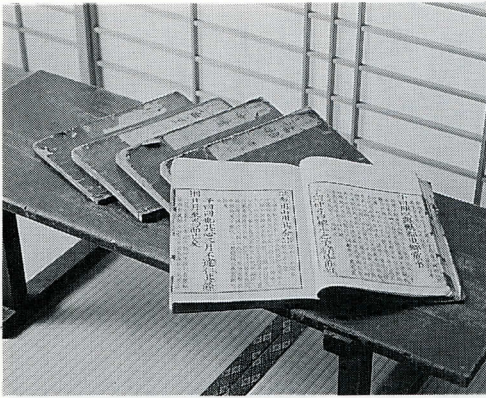
少年時代学んだ四書と机