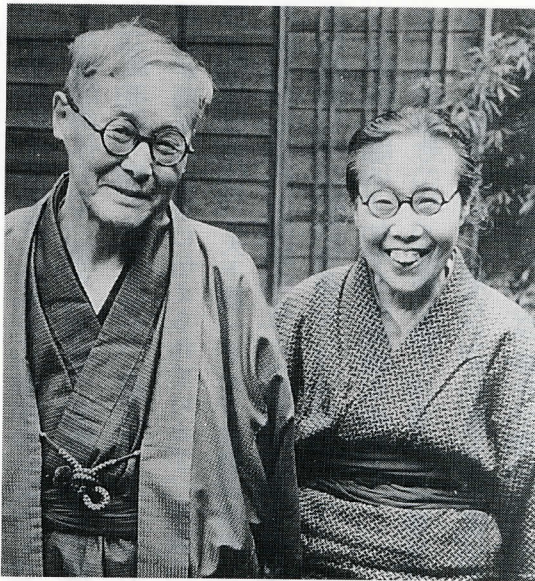
東京都武蔵野市境の自宅で妻と

た鎌倉時代と、明治維新期の時代です。それらの研究を重ねるに従い、時代を徐々にさかのぼり、結果的に『古事記』と『日本書紀』にたどりつきました。この研究の成果を『神代史の新しい研究』にまとめ、これをかわきりにつぎつぎと著作を発表しました。