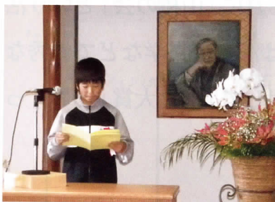
作文を発表する児童