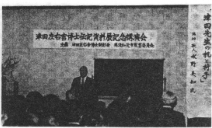
津田先生の机と椅子 美濃加茂市教育委員会蔵

今回の資料点数は百四十二点にのぼり、これら資料の紹介や資料所有者とのご縁を大切にして、今後の顕彰会活動に生かしてゆく予定です。