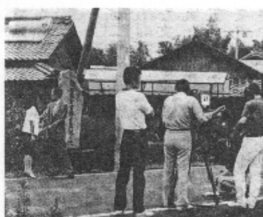
名古屋テレビ番組制作ロケ風景