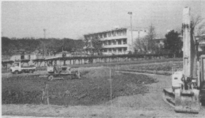
津田生家の移築予定地（工事中）