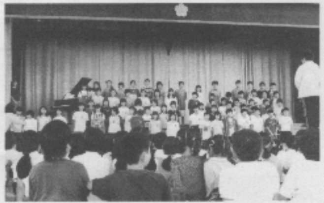
下米田小学校 学習発表会