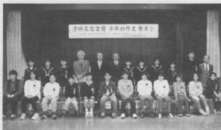
津田賞入賞者 記念撮影