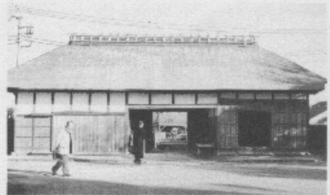
杉並区立郷土博物館(旧井口家住宅長屋門)

津田左右吉博士顕彰会が作つている津田博士の像を刻んだ文鎮が展示物の中央に飾られて、わが顕彰会とこの記念室との繋