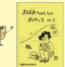
おぼあちゃんのおかって No.3 A5判・P31・100円