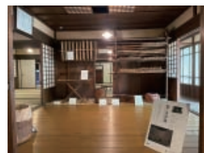
生活体験館「まゆの家」

美濃加茂地方では明治末期から養蚕が盛んにおこなわれるようになりました。暮らしの中で養蚕の道具たちがどのように使われ、また姿を変えていったのか。人々と蚕の紡いできた歴史を紹介します。