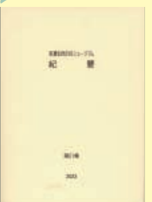
「紀要 第21集」 A4判・P111・500円