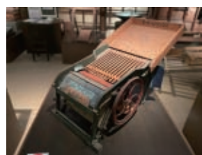
民具展示館「毛羽取り器」