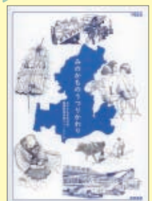
「みのかものつりかわり」 A4判・P43・500円

美濃加茂市の交通や暮らしなどのつりかわりについてまとめた冊子です。小学3年生の社会科「市のつりかわり」の学習に対応しています。