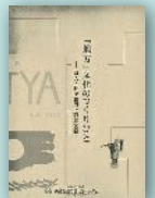
「地方」文化のつくりびと 詩人・長尾和男と若葉文藝 B 5判 48ページ 500円