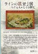
「ラインの風景」展 めぐる人々とその歴史 A 4判 12ページ 200円