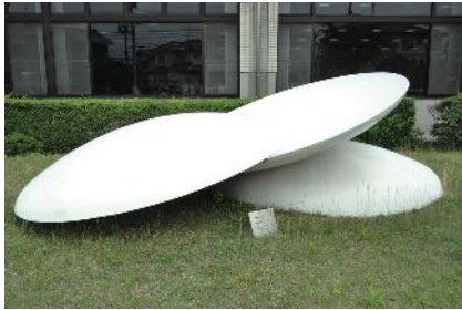
1995年 彫刻シンポジウムで制作された円盤2 大北利根子