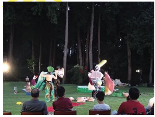
2018年度 劇団「犬大丈夫」による『風と共に去りぬ』上演の様子