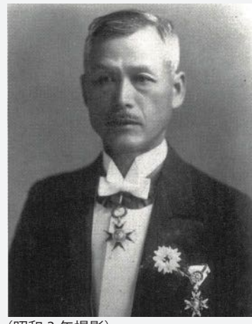
(昭和3年撮影)

会期 2019年 7月20日(土) ~ 9月8日(日) 会場 企画展示室 [9月3日(火)~美術工芸展示室] 観覧無料