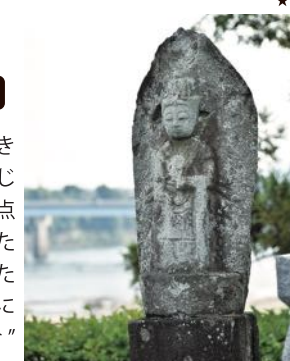
廻国供養塔（美濃加茂市川合町）

人は古来より石に文字やかたちを刻んできました。私たちの身の周りには、石仏をはじめ、記念碑や道標などさまざまな石造物が点在します。すべてはその場所で見つめてきた歴史を確かに物語り、名もなき人たちのひたむきな思いがにじむようです。路傍で静かに建ち続ける石の声に耳を傾け、「石に刻む」という人の営みについて思いを巡らせます。