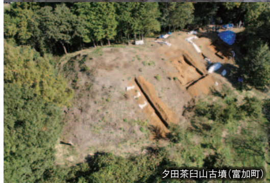
夕田茶白山古墳(富加町)