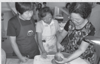
約1,400年前の「土器」調査(9/11) 【美濃加茂市民ミュージアム】