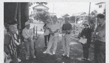
1.川合町の昔を聞く(美濃加茂市)