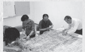
3.古文書を調べる(富加町)