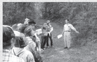
夕田地区を訪ねる(10/14) 【富加町夕田・いきいき楽学塾】