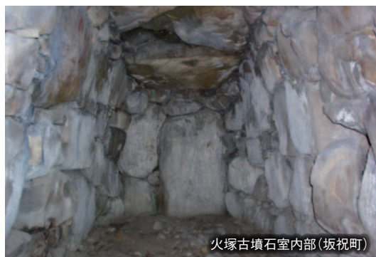
火塚古墳石室内部(坂祝町)

【定住自立圏構想】継続的に暮らし続けることができるような、住みやすいエリアを目指す計画を「定住自立圏構想」といいます。この事業は、人口5万人以上の「中心市」を定め、中心市と周辺の町村が協力し、まちづくりを行っていくものです。美濃加茂市と周辺の町村は、民間企業等と協定を結び、加茂エリア全体の活性化を目指して活動しています。現在は市町村でお互いの良いところを活かしたい、協力した活動が進められています。本展は、その一環として開催されます。