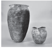
土師器壺(美濃加茂市・今遺跡)

1万年をさかのぼる歴史が知られる、加茂という地域については、各時代の遺跡が今も現地に残されています。そこでは長年にわたって発掘などの調査が行われてきたことで、確かにこの地域に暮らしていた、古代の人々の営みを知ることができるようになってきました。