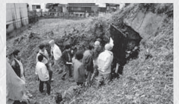
2.火塚古墳を訪ねる(坂祝町)