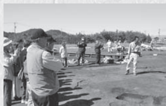
東野遺跡を訪ねる(10/19) 【坂祝町黒岩・大針・かもまる歴史講座】