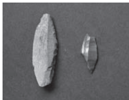
ナイフ形石器(坂祝町・東野遺跡) 岐阜県文化財保護センター 蔵