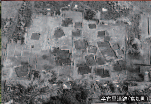
半布里遺跡(富加町)