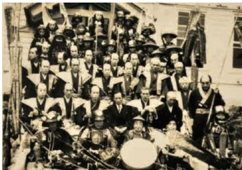
▲伊深村役場庁舎前での記念撮影 (1954年)