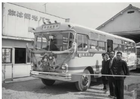
▲美濃太田駅前行われたテープカット