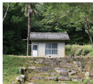
▲トタン造りの薬師堂。右奥にも石仏が見える

三和町川浦にある薬師堂の付近には、数多くの石造物が点在しています。中でもひときわ目を引くのが、参道の途中にある灯籠形の石造物。「石幢」と呼ばれるこの石造物は、貞享元（1684）年に造立され、人の背丈を超える大きさで、火をともし部分には六地藏（六道の思想に基づき人々を救う6体の地藏）が表されています。石幢は近世以降、東濃地域で多く造立されたものの、中濃地域では非常に少なく、時代的にも貴重なものです。 また、本堂脇の厨子の中には、延宝9（1681）年に作られた市内最古の石像薬師仏がまつられています。 この場所は、以前は引導場と呼ばれる共同墓地であったと考えられ、石幢をはじめとする石造物は、死者の冥福を祈り、供養するために造られたものでしょう。6体の地藏は妙鉢（葬儀で使われる楽器）やお鈴などの仏具を持ち、柔らかな表情をたたえています。 古くからこの一帯は地域の人々の大切な祈りの場であり、心のよりどころだったのです。 【参考】市教育委員会「美濃加茂の石仏（1988）」