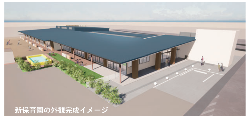
新保育園の外観完成イメージ