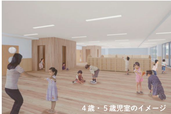
4歳・5歳児室のイメージ

「保育園」をコンセプトにした新たな保育園が開園します。 市立保育園では初めて、園舎内に中庭を設置し未満児が安心してゆっくり遊ぶことができる落ち着いた空間を提供します。 また、少子化による園児数の減少も見越し、4歳・5歳児室に壁は作らず、棚で部屋を区切るように設計。園児数に応じ、棚の位置を変えて対応します。 このほか、食育の一環で、給食調理室の廊下側に窓を設けて園児が調理の様子を見えるようにしたり、園の西側には交流工