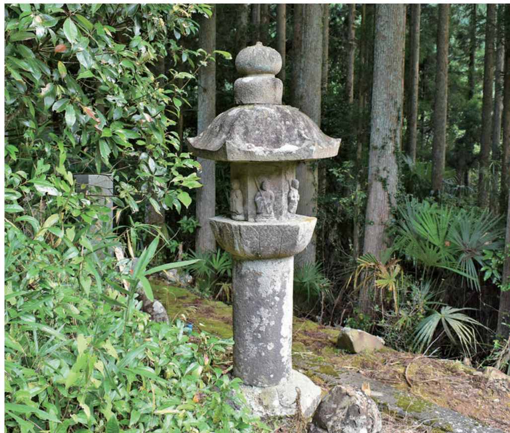
▲参道で存在感を放つ石幢

特集で紹介する新保育園では、子どもたちや保護者、地域の人たちと一緒に園庭を作っていく計画があります。自然の中から遊びを創造する子どもたちをイメージし、新保育園への統合が決まっている古井第一保育園で撮影しました。