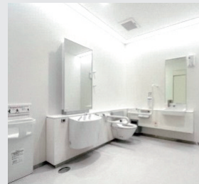
▲多目的トイレの例