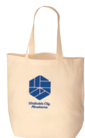
▲オリジナルノベルティ