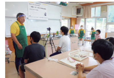
▲エジソンの会によるサイエンス教室

3・4年生は理科教員がサイエンス教室を行いました。科学の芽が育つことを願っています。