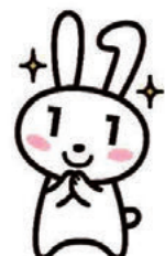
▲PRキャラクターマイナちゃん