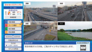
▲同チャンネルの情報配信画面