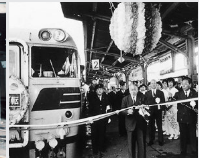
▲特急「ひだ」が初運行 (昭和43年)

43年をピークに減少。平成19 年に岐阜―高山駅間の貨物輸送 は廃止されました。