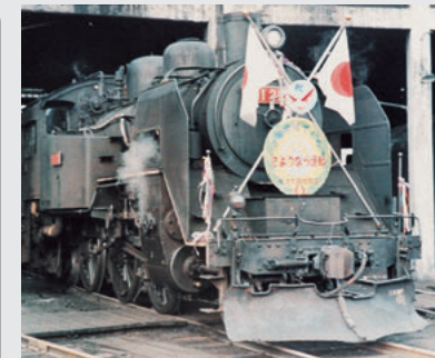
▲さようなら蒸気機関車 (昭和44年)

その後、昭和43年に旅客輸送 の拡大とスピード化を図るた め、それまで急行だった「ひだ 」を特急に格上げして運行を開 始。平成元年には新型の車両が 導入され、現在も「ワイドビュー ひだ」として親しまれています。 そして飛騨方面から木材など を運んでいた貨物列車は、道路 交通網の整備などによって昭和