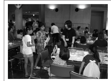
「ふらっとみゆーじあむ」で来館者と