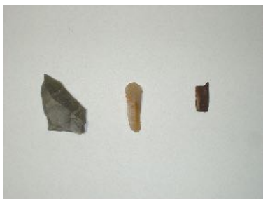
市橋北野遺跡出土品

明治時代以来、加茂地域の考古学的成果は、岐阜県内はもとより、各地の研究者から注目を集めてきました。そのうちの一つが、北野遺跡:美濃加茂市、海老山遺跡:富加町に代表される旧石器時代です。学術的な成果を捉え直すと共に、それらの発見や調査に関わり合った地域の人々の姿をふりかえる機会とします。