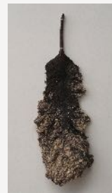
Untitled-Feather duster | 2014