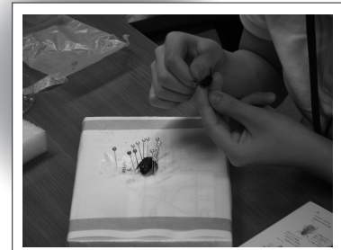
カナブン・コクワガタの標本作製

また参加者には、子ども時代に文化の森で授業を受けたこと、講座を受講した思い出を大切に持ち続けてくれている方もおり、スタッフにとっては、とてもうれしいお話を聞くこともできた5日間でした。(S.F)