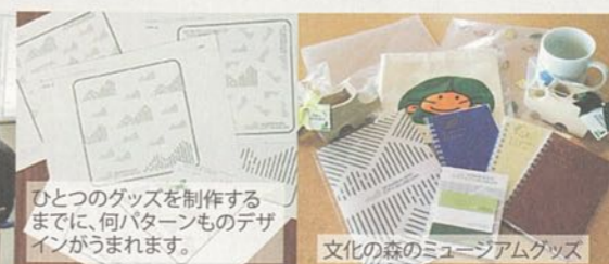
文化の森のミュージアムグッズ