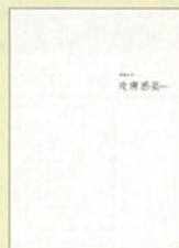
皮膚感覚 阿部大介展記録集 A5判 36P 300円