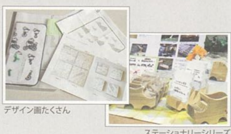
デザイン画たくさん

グッズが完成するまでには、文化の森のスタッフだけでなく、デザイナーさんをはじめとする大勢の方の知恵や協力が欠かせません。皆で、あてもない、こうでもないと悩みながらも、お客様の手元へ届いたアイテムが文化の森を思い出すための、ちょっと「特別」な存在になることを願いながら作っています。