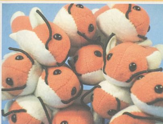
ミュージアムグッズ「ネコギギマグネット」