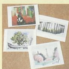
ポストカード各種 1枚100円