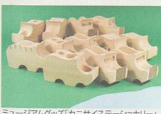
ミュージアムグッズ「カニサイズステーションナリー」

【ミュージアムグッズ】「博物館」の資料や作品をもとに、開発・販売された商品で、文房具、衣類、食品、インテリア用品など多岐にわたります。(文化の森にもオリジナルグッズがあります)