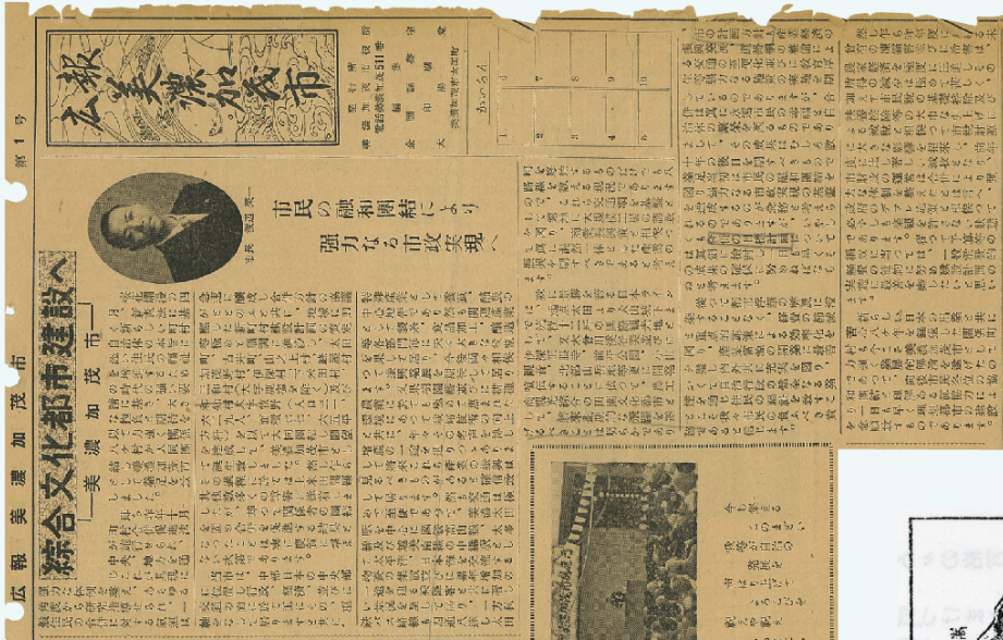
来月中旬に竣工 白亜の殿堂「中濃体育館」