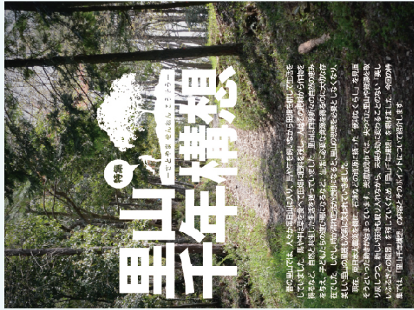
「里山千年構想」 (『広報みのか七』2014年5月1日号)