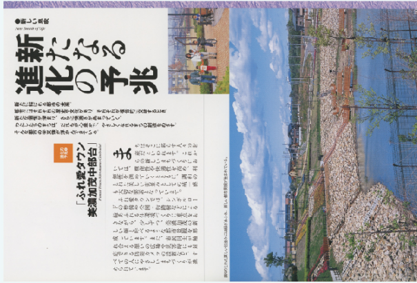
「新たな進化の予兆 ふれ愛タウン美濃加茂中部台」 (『日進月歩 - 美濃加茂市制60周年記念誌 -』2004年)