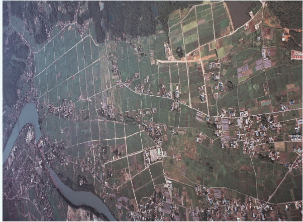
「木曽川右岸東部」(木曽川右岸用水事業) (昭和48年撮影)