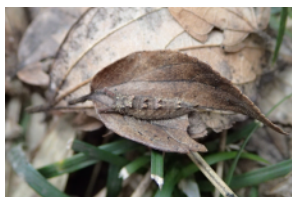
オオムラサキの幼虫 須恵器（中之番／7世紀）