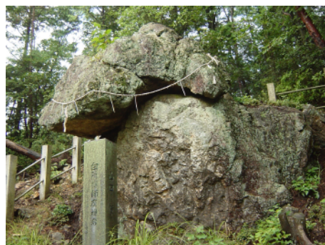
白隠の座禅岩（岩滝山）