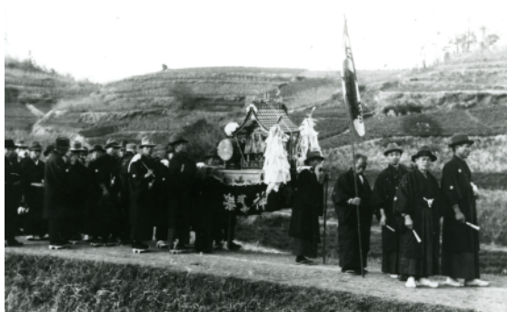
春の祭礼（十二社神社／昭和11(1936)年）

山之上に関する古写真、古文書、その他の記録類。 暮らしや（年中）行事・土地にまつわる思い出、 記憶（記録）画、（絵画、文芸等の）作品、 出土品（矢じり、土器）、動物や植物、化石 など。