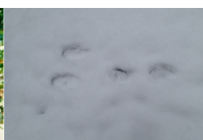
ニホンノウサギの足跡

みのかも文化の森／美濃加茂市民ミュージアム 〒505-0004 岐阜県美濃加茂市蜂屋町上蜂屋 3299-1 TEL 0574-28-1110 FAX 0574-28-1104 http://www.forest.minokamo.gifu.jp/